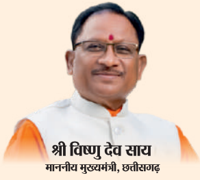
श्री विष्णु देव साय माननीय मुख्यमंत्री, छत्तीसगढ़